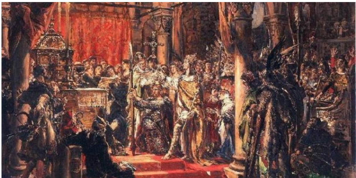
Koronacja Bolesława Wielkiego Chrobrego – 18 kwietnia A.D.1000 lub 1025 - Jan Matejko