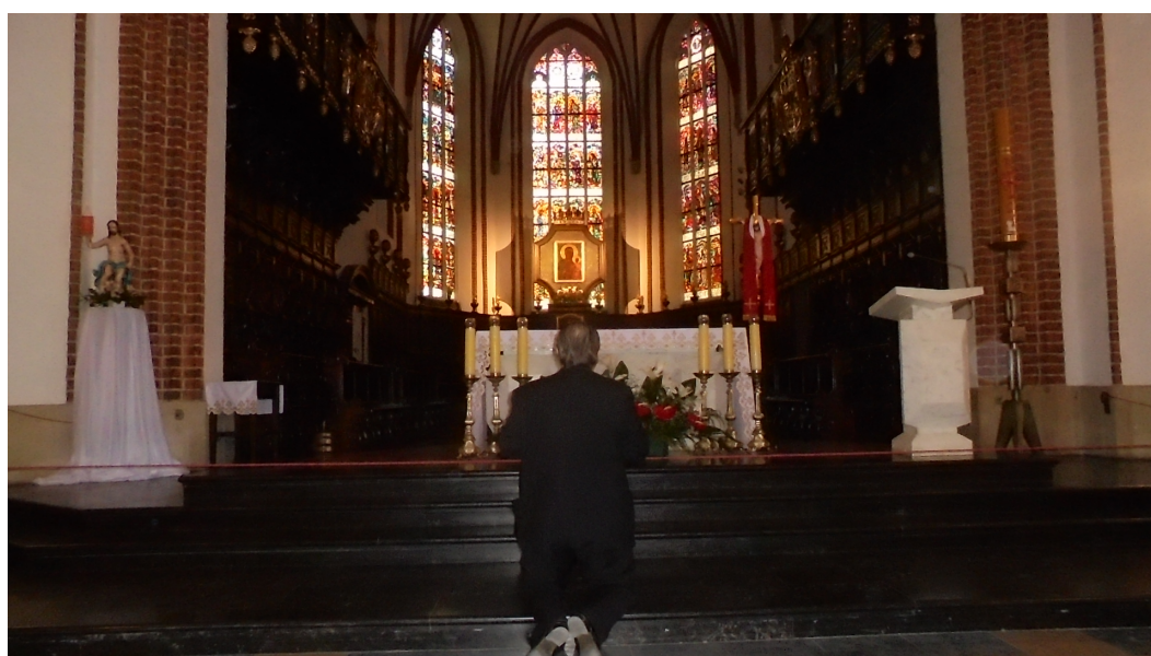
Królewskie Śluby Lwowskie – 18 kwietnia A.D.2018 Warszawa, Katedra koronacyjna pw. św. Jana Chrzciciela