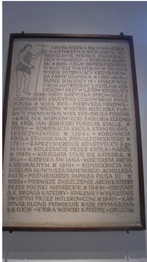
Tablica z kruchty Katedry