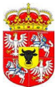
Wojciech Edward Rex Poloniae

Dano w Myszkowie n/Wartą 9 września A.D. 2016 w pierwszym roku naszego panowania