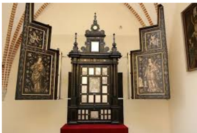
Srebrny Ołtarz Darłowski z odłączonymi drzwiami

Budowa obu ołtarzy koncepcyjnie jest tożsama i w swym wyrazie wyraźnie antyprotestancka, co szczególnie zadziwia w przypadku „Srebrnego Ołtarza Darłowskiego” powstającego w sytuacji panowania na Pomorzu protestantyzmu i będąc ufundowany przez książąt oficjalnie protestantów.