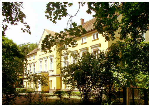
Pałac przy stadninie ogierów w Sierakowie