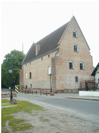
Zamek Opalińskich w Sierakowie I Posiedzenie (godz. 11-13)