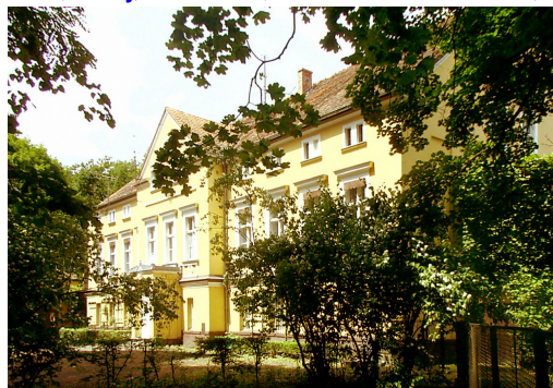
Pałac przy stadninie ogierów w Sierakowie

ZAKRES FUNKCJONOWANIA W KOLEJNYCH LATACH, ROTA ŚLUBOWANIA, CEREMONIAŁ PATRONAT, SIEDZIBA, ORGANIZACJA - ROTY DIECEZJALNE, DEKANALNE, PARAFIALNE ROTMISTRZOWIE, KONFEDERACJA?, TRYB ZWOŁYWANIA, PRZYSTĘPOWANIE, STRÓJ, CHARYZMAT, WSPÓLNOTA CZY ZAKON?, WAŻNE DATY