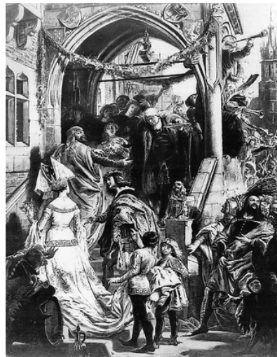
Jan Matejko – Uczta u Wierzyńka

W Zjeździe wzięli udział: cesarz (jednocześnie król czeski) Karol IV, królowie: Ludwik Węgierski, Piotr cypryjski, oraz liczni książęta: książę austriacki Rudolf IV Założyciel, książę mazowiecki Siemowit III, książę opolski Władysław Opolczyk, książę świdnicki Bolko II Mały, książę wołogosko-słupski Bogusław V z synem Każkiem słupskim, margrabiowie brandenburscy Ludwik VI Rzymianin i Otto V Leniwy. Pretekstem do zwołania zjazdu krakowskiego była zapewne kwestia krucjaty antytyureckiej, w czym szczególnie zainteresowany był uczestniczący w uczcie król Cypru Piotr Lusignan, który podróżował po Europie w poszukiwaniu wsparcia w obronie swej wyspy. W rzeczywistości głównym przedmiotem zabiegów dyplomatycznych były problemy związane z równowagą polityczną w środkowej Europie. Sam zjazd, odbyty we wspaniałej oprawie, pomyślany był także jako manifestacja potęgi i bogactwa króla polskiego, odbił się głośnym echem w Europie. WIKIPEDIA