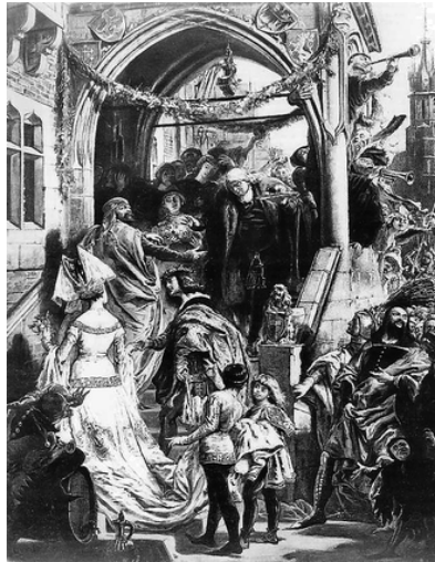
Jan Matejko – Uczta u Wierzyńka

W Zjeździe wzięli udział: cesarz (jednocześnie król czeski) Karol IV, królowie: Ludwik Węgierski, Piotr cypryjski, oraz liczni książęta: książę austriacki Rudolf IV Założyciel, książę mazowiecki Siemowit III, książę opolski Władysław Opolczyk, książę świdnicki Bolko II Mały, książę wołogosko-słupski Bogusław V z synem Każkiem słupskim, margrabiowie brandenburscy Ludwik VI Rzymianin i Otto V Leniwy. Pretekstem do zwołania zjazdu krakowskiego była zapewne kwestia krucjaty antytyureckiej, w czym szczególnie zainteresowany był uczestniczący w uczcie król Cypru Piotr Lusignan, który podróżował po Europie w poszukiwaniu wsparcia w obronie swej wyspy. W rzeczywistości głównym przedmiotem zabiegów dyplomatycznych były problemy związane z równowagą polityczną w środkowej Europie. Sam zjazd, odbyty we wspaniałej oprawie, pomyślany był także jako manifestacja potęgi i bogactwa króla polskiego, odbił się głośnym echem w Europie. WIKIPEDIA