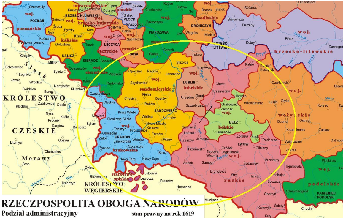
RZECZPOSPOLITA OBOJGA NARODÓW Podział administracyjny stan prawny na rok 1619