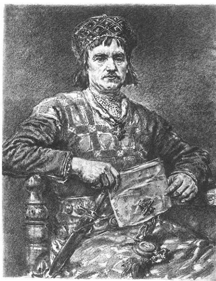
Bolesław V Wstydlivy (Cnotliwy, Roztropny)

Zjednoczyciele Ziemi Polski w czasach tzw. rozbicia dzielnicowego